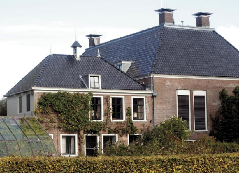
Zuidgevel van Schatzenburg te Dronrijp