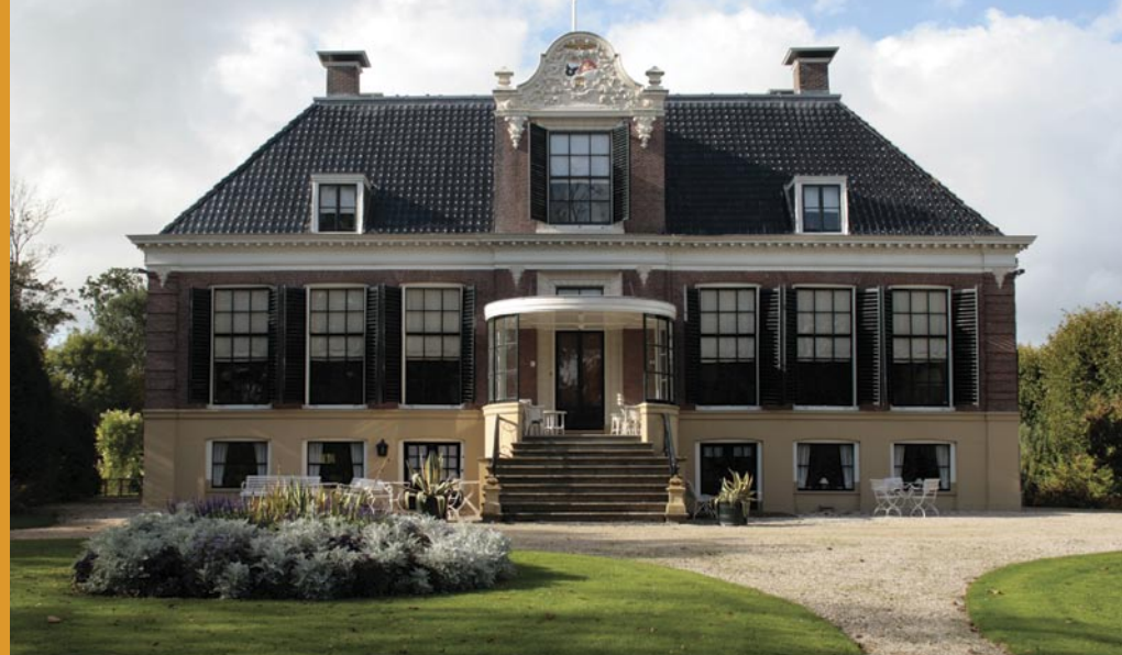
Schatzenburg te Dronrijp